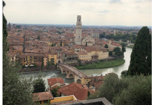
Ein wunderschöner Blick auf Verona

Es war eine wunderschöne Reise mit tollen Erlebnissen und ganz vielen neuen Eindrücken. Wir freuen uns aufs nächste Jahr!