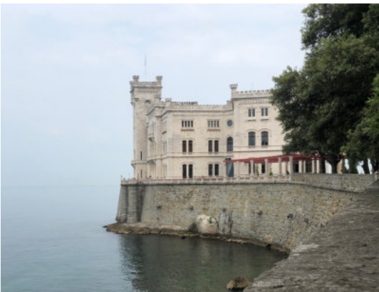
Schloss Miramare bei Triest

Auch dieses Jahr war uns das triste Ferienleben unter einem festen Dach mit langweiliger, immer gleicher Umgebung zuwider, und so verschlug es einen Teil der Pfarrjugend St. Christoph nach Italien. Am 5. Juli brachen die sieben Reisenden in den Morgenstunden gegen Süden auf. Erstes Ziel: ein Campingplatz in der Nähe von Triest.