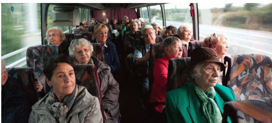
Die "Freunde von St. Helena" unterwegs im Reisebus ...