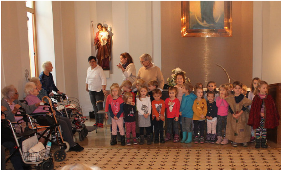
Gruppenfoto der Kindergartenkinder beim Martinsfest im Marienheim C. Machovicz

Ganz nach dem Motto "Jung und Alt gehören zusammen" fördert das Team des Ökumenischen Kindergartens den Kontakt zwischen den ganz Kleinen und den Seniorinnen und Senioren im Marienheim.