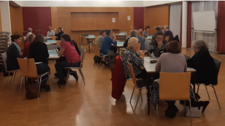
Austausch in Kleingruppen