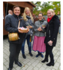
Mehr auf www.baden-st-christoph.at/galerie/erntedank2019