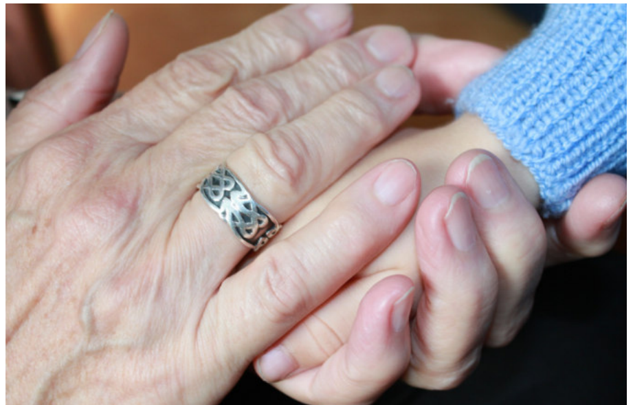
Generationen im Dialog - eine Bereicherung für alle