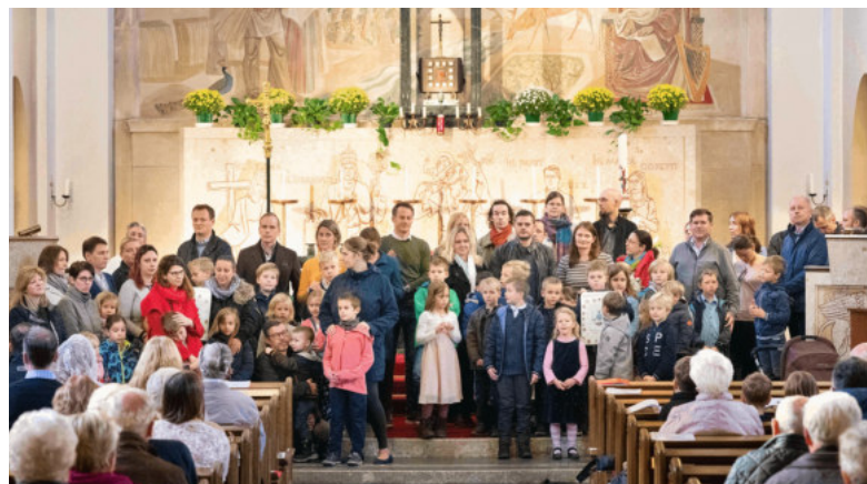
Die Erstkommunionkinder mit ihren Familien