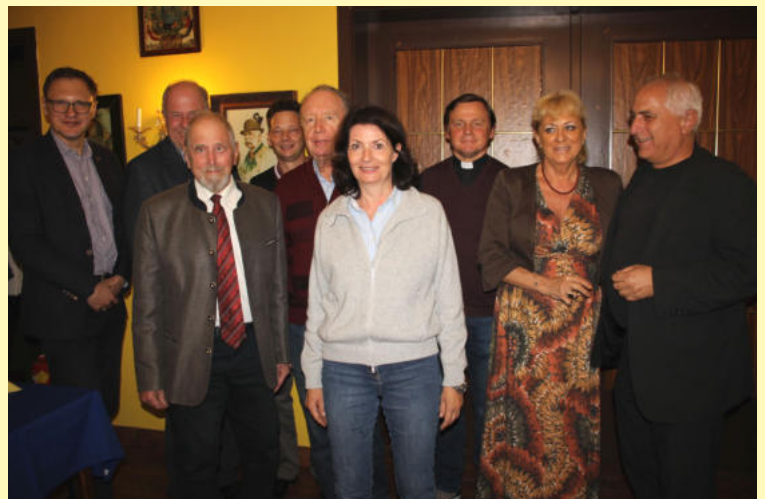
Das neue Führungsteam der Freunde von St. Helena