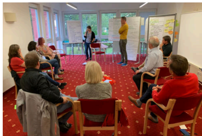
Intensive Arbeit - hier in der Großgruppe mit zwei Coaches