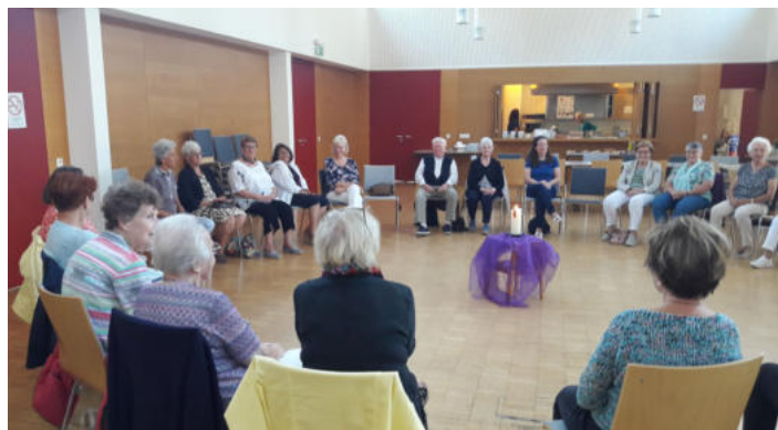
Blick in die Runde der Teilnehmer:innen

verschiedene Formen und Veränderungen, die dieses Sakrament im Lauf der Geschichte erfahren hat. Er sprach auch über die Wirkung der Beichte und darüber, was man unternehmen kann, um die Beichte so befreiend, aufbauend und stärkend wie möglich zu erleben. Dem Vortrag folgten eine lebhaft-