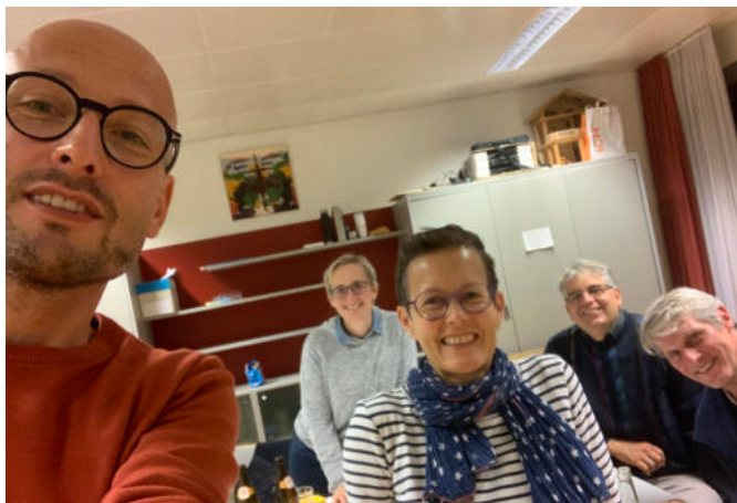
"Ausschuss Schöpfungsverantwortung" - erstes Treffen

Nach einer kurzen Einführung über die allgemeinen Organisationsstrukturen und Liegenschaften ging es ans Sammeln von Ideen. Von Mülltrennung am