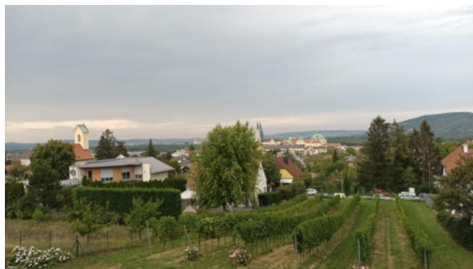
Eindrücke vom Seniorenausflug

nerin vor Ort klärte uns auf, dass mir Google Unsinn erzählt hatte, und übernahm selbst den geschichtlichen Vortrag, was mir sehr recht war. Es ging dann weiter nach Cobenzl in den Waldgrill zum Mittagessen. Dort gestand mir der Kellner, dass er sich in eine unserer Damen verliebt hätte. Es gibt nichts, was es nicht gibt. Ich konnte ihm leider nicht helfen, das übersteigt meine Kompetenzen. Wir mussten den gastlichen Ort wieder ver-