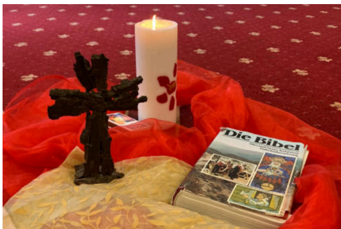
Jesus und das Wort Gottes als unsere Mitte

Frei nach dem Propheten Jeremia: "Denn ich, ich kenne meine Pläne, die ich für euch habe - Spruch des Herrn -, Pläne des Heils und nicht des Unheils; denn ich will euch eine Zukunft und eine Hoffnung geben" (Jer 29,10). Kommen wir gemeinsam dem Heilsplan Gottes für unsere Pfarrgemeinde auf die Spur!