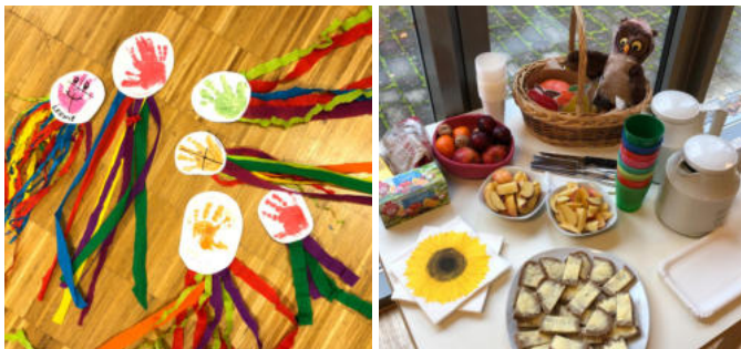
Eindrücke aus der Spielgruppe, oben: Anna & Leni