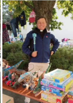
Buntes Treiben auf dem Kirchenplatz