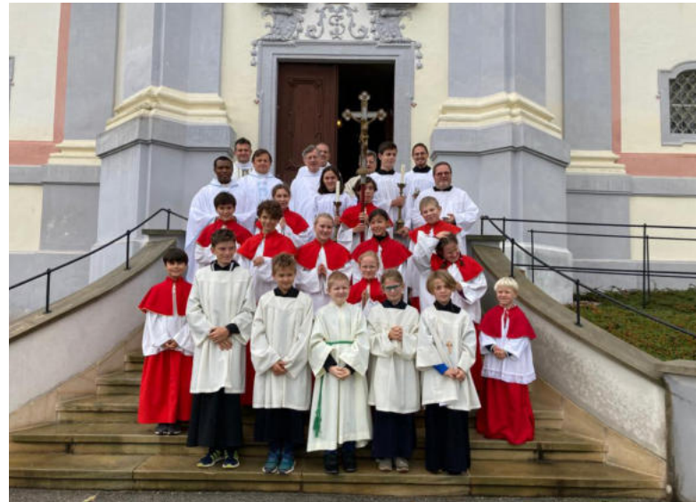
Ministrant:innen aus St. Christoph mit ihren Kolleg:innen aus dem Seelsorgeraum bei der Wallfahrt zum Mariahilfberg (Gutenstein)

Gemeinschaft, Dienst am Altar, Spiel und Spaß, monatliche Ausflüge (z.B. Kino, Führungen, Mini-Treffen) u.v.m. warten AUCH AUF DICH!