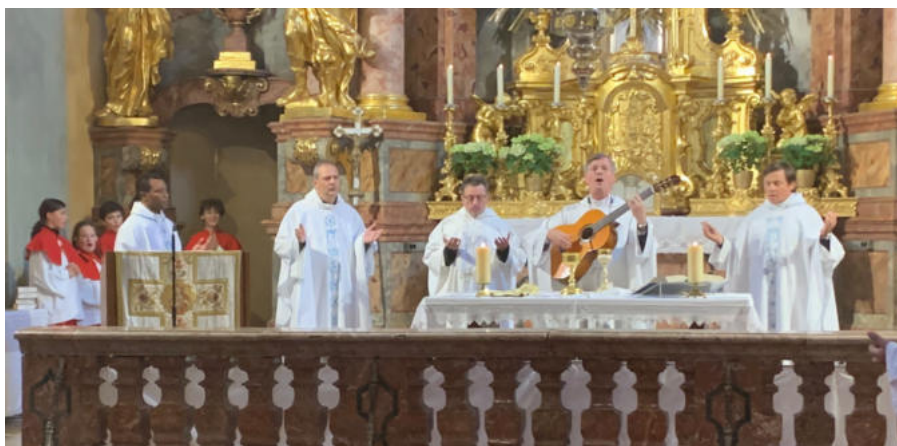
Heilige Messe in der Wallfahrtskirche am Mariahilfberg