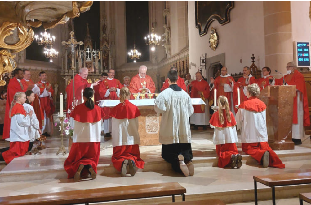
Startgottesdienst in St. Stephan