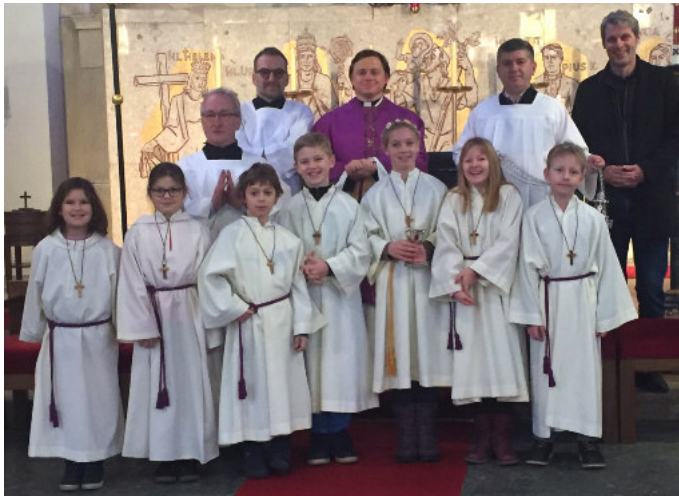
Die jungen Ministrantinnen und Ministranten mit ihren erwachsenen Kollegen und Begleitern.

derzeit in St. Christoph diesen Dienst. Einige neue bereiten sich auf die Aufnahme vor. Egal ob Kind oder Erwachsener,