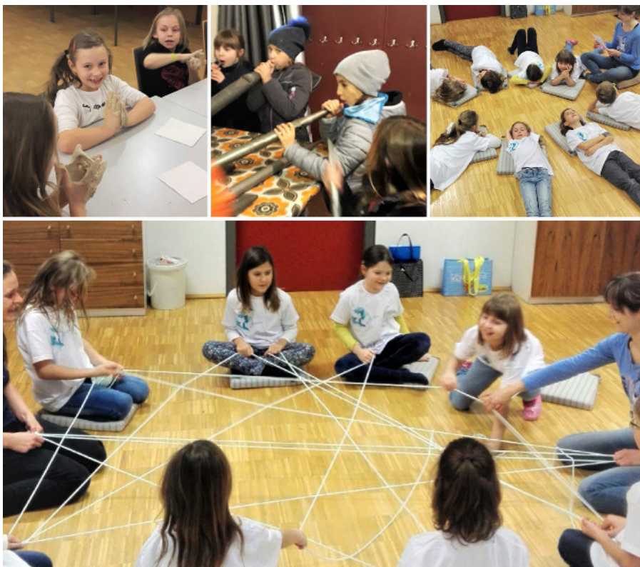
Fotos aus den Erstkommunion-Vorbereitungsstunden: 1: Brotbacken, 2: Orgelpfeifen beim Kirchenrundgang, 3: Geschichten über Jesus lauschen, 4: Wir alle sind miteinander verbunden.

manche auch zusätzlichen Lebensinhalt bieten."