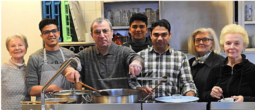
Die Suppentagsmannschaft im Zentrum des Geschehens.

Leckere Suppen und Eintöpfe genießen und dabei Gutes tun - das ist der Suppentag in St. Christoph.