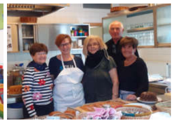
Bereit für den Besucheransturm