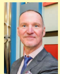
Text: K. Lughofer

Festkonzert "20 Jahre Rieger-Orgel" (2017). Georg möchte nun einmal die Wochenenden nicht auf der Empore verbringen. Wir gönnen es ihm, sagen danke und wünschen alles Gute!