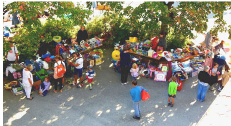
Buntes Treiben auf dem Kindersachenflohmarkt

Zu Mittag stand fest, dass auch dieser Flohmarkt in Zukunft seinen fixen Platz im Pfarrjahr haben wird.