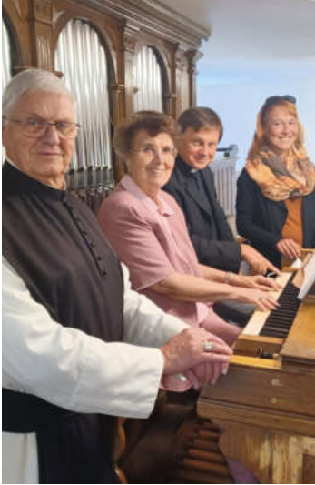
Große Freude über die gelungene Orgelrenovierung